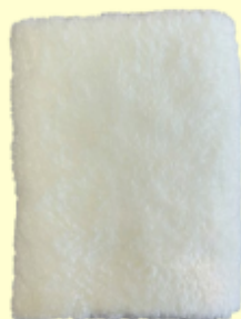
洗車スポンジ白タオル