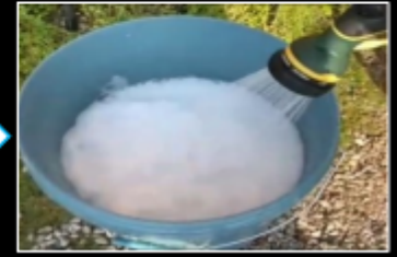
シャワーモードで泡を慣らす