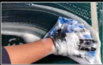
青タオルを二つ折にして 泡をすくって滑らす