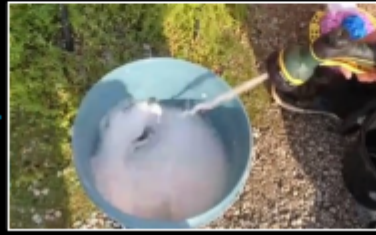
ジェットモードで泡立てる